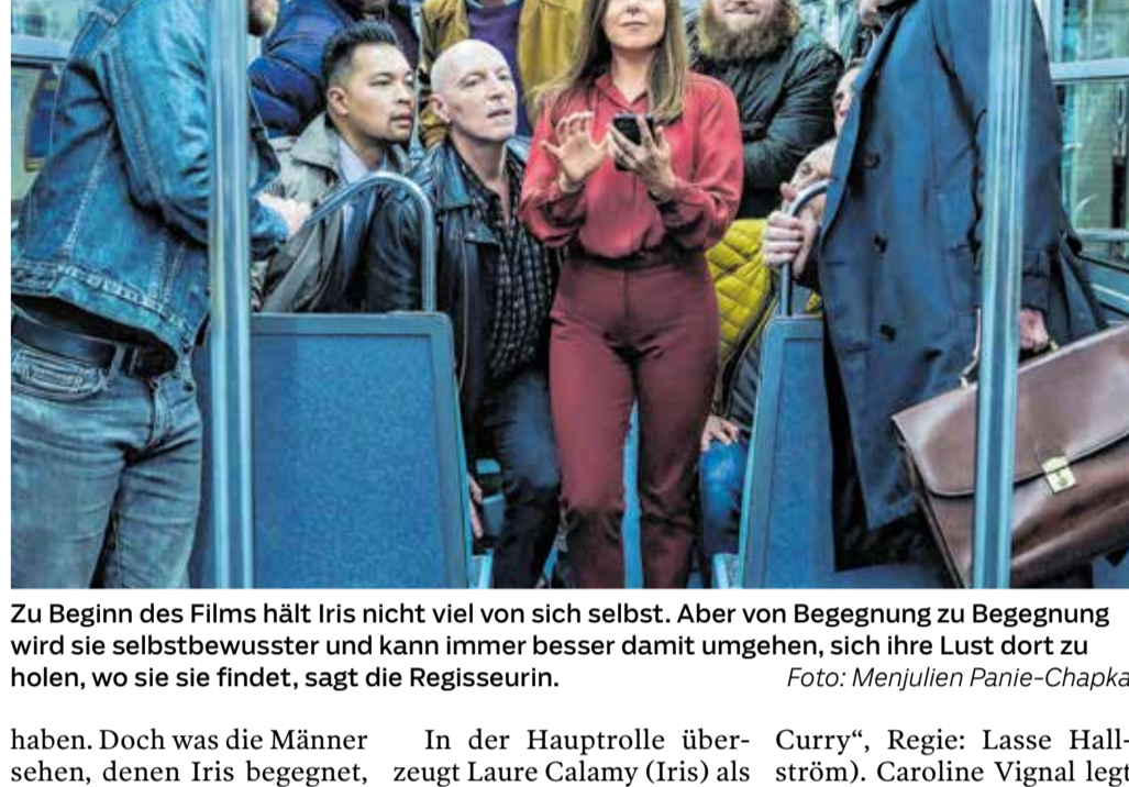
Zu Beginn des Films hält Iris nicht viel von sich selbst. Aber von Begegnung zu Begegnung wird sie selbstbewusster und kann immer besser damit umgehen, sich ihre Lust dort zu holen, wo sie sie findet, sagt die Regisseurin.